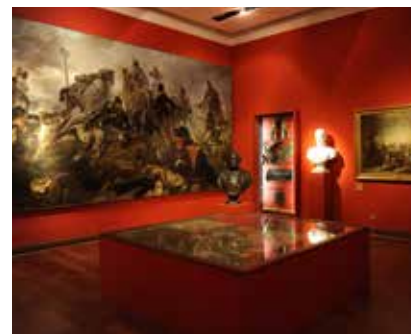
Museo del Risorgimento

MUSEO ARCHEOLOGICO DI MILANO: il museo ha sede nell'ex convento del Monastero maggiore di San Maurizio, dove si trovano le sezioni greca, etrusca, romana, barbarica e del Gandhara. La sezione egizia è ospitata presso il Castello Sforzesco.