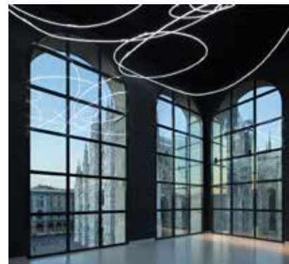
Museo del Novecento

GALLERIA D'ARTE MODERNA DI MILANO: si tratta della più importante collezione lombarda di opere