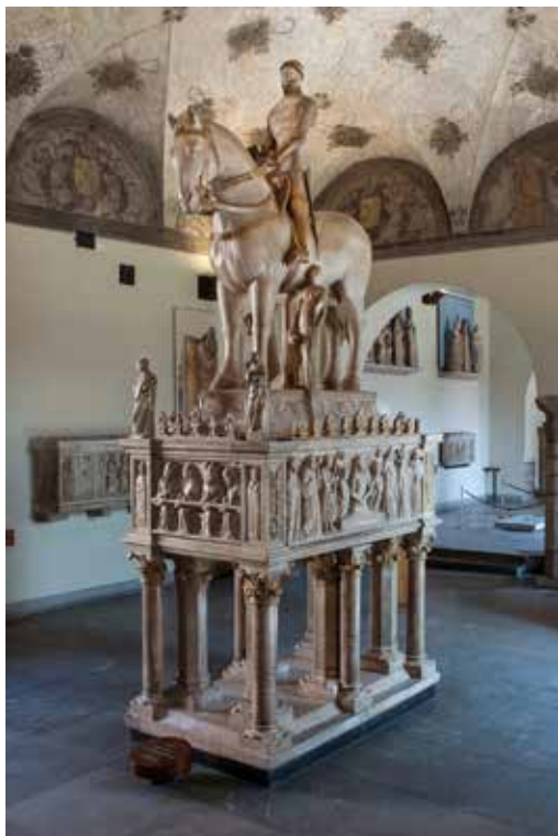
Museo Arte Antica - Monumento equestre a Bernabò Visconti

Sui siti internet delle strutture si possono trovare gli orari di apertura.